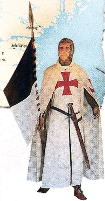
Tempelriddaren Arn från utställningen "Arns tid" vid Forsviks bruk.