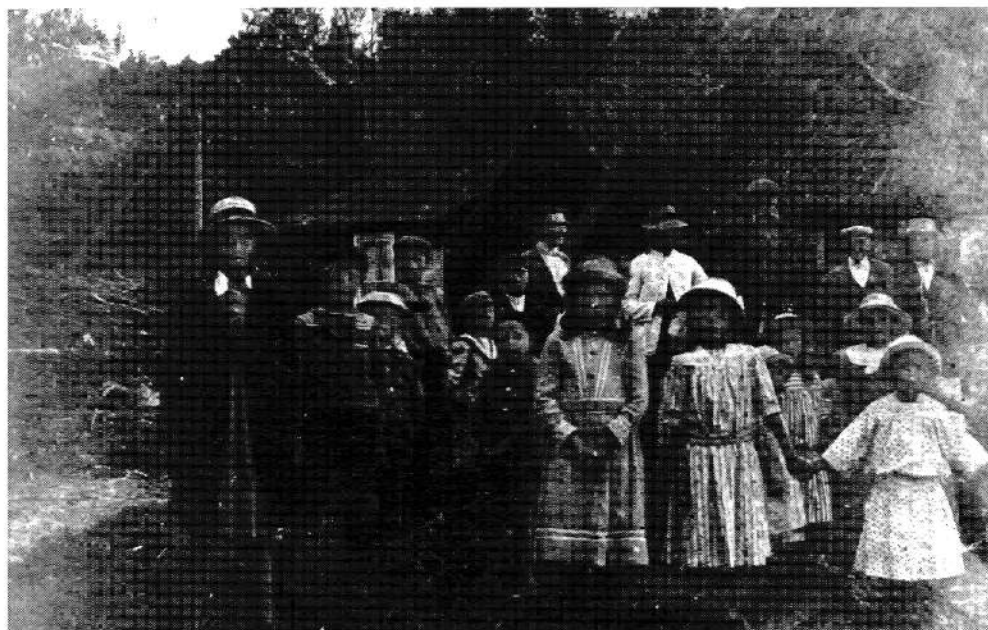
Befolkningen på Broslätt vid midsommarfest på "gadan" ca 1917. I bakgrunden syns Reimers' långa med brunnjungen vid södra gaveln.