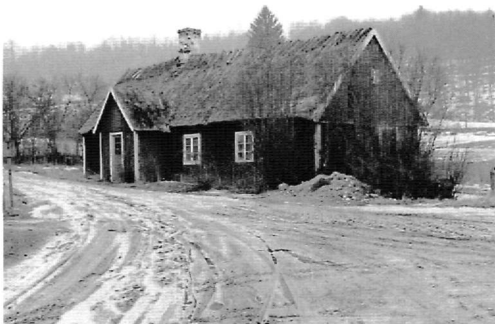
Reimerska boningslängan vid gadan, riven 1961. 1960.