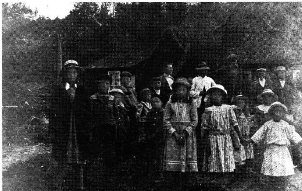
Befolkningen på Broslätt vid midsommarmfest på "gadan" ca 1917. I bakgrunden syns Reimers' länka med brunnjungen vid södra gaveln.