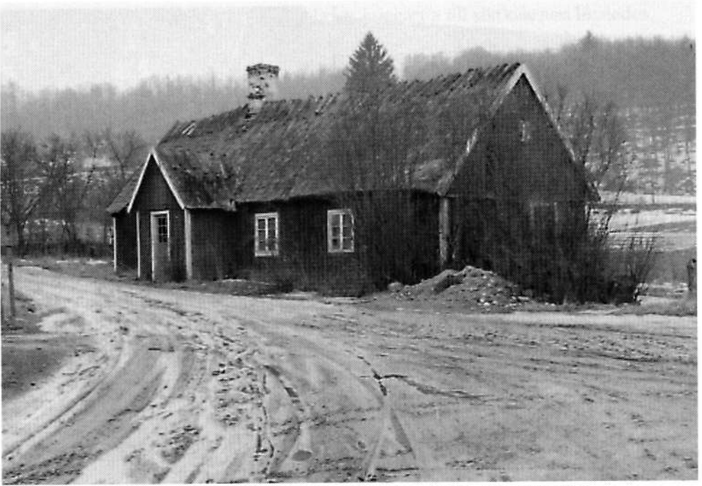
Reimerska boningslängan vid gadan, riven 1961.