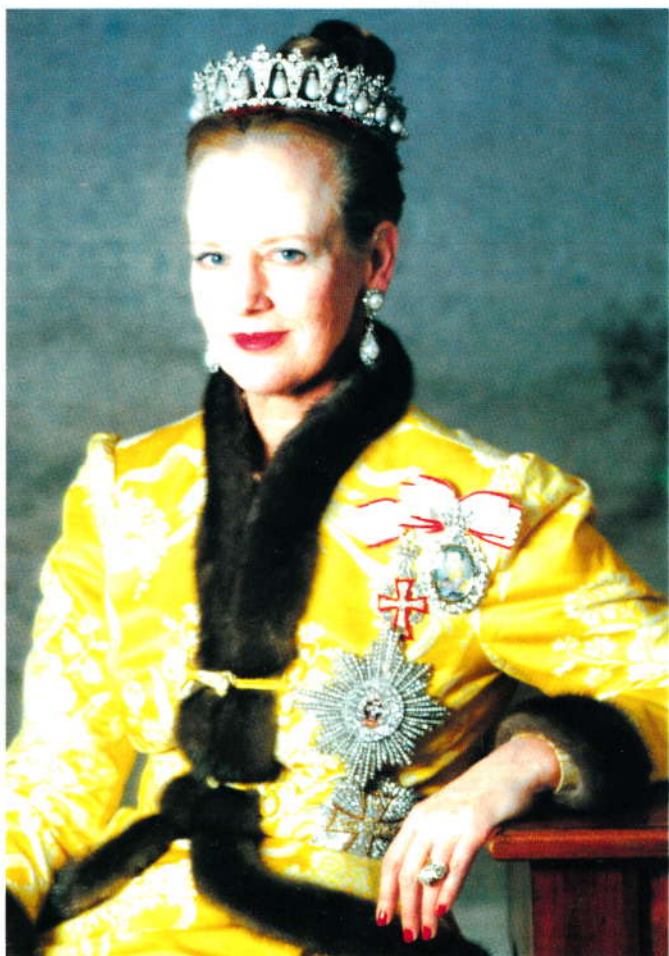
Hendes Majestæt Dronning Margrethe Nordisk Studentersangerstævnes protektor